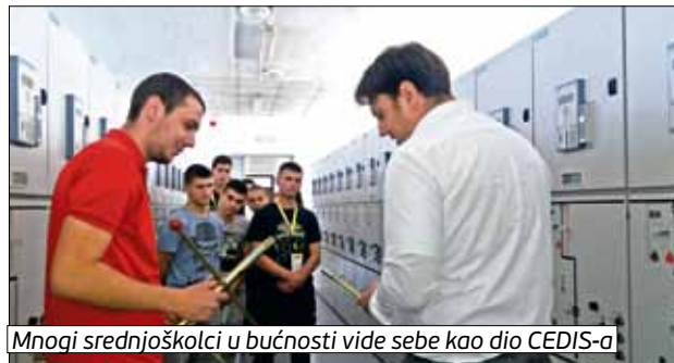
Mnogi srednjoškolci u budnosti vide sebe kao dio CEDIS-a