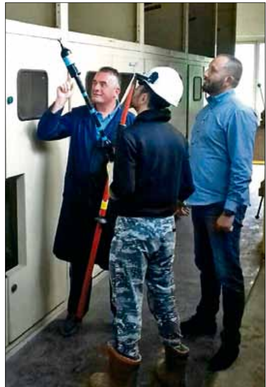
Učenici su upućeni u proces upravljanja i mjerenja u elektrodistributivnom sistemu, a đaci iz Bijelog Polja su posjetili i mHE Bistrica