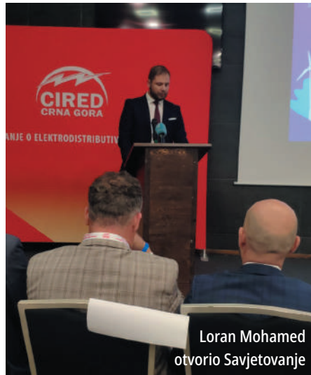
Loran Mohamed otvorio Savjetovanje

Događaj je svečano otvorio Loran Mohamed , državni sekretar u Ministarstvu energetike, koji je čestitao organizovanje Prvog savjetovanja, te svim učesnicima zaželio uspješan i koristan rad.