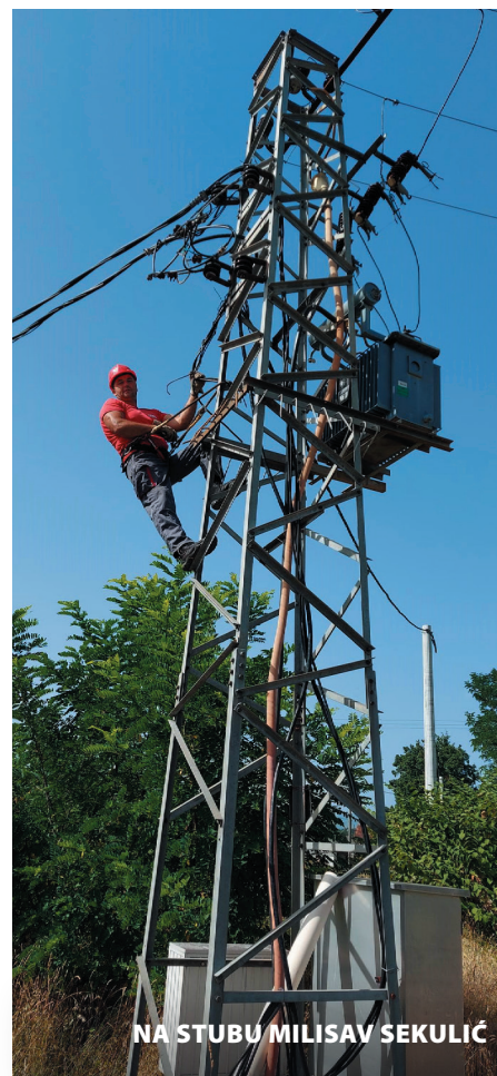
NA STUBU MILISAV SEKULIĆ

U prvom polугоđu fokusirali su se na revitalizaciju NN mreža, a zatim će preći na DV „Danilovgrad iz Podanja“ na kojem u okviru revitalizacije treba da se ugradi 30 novih stubova i zamijeni tri kilometra provodnika, a ugradiće se i pet rastavljača na određenim di-