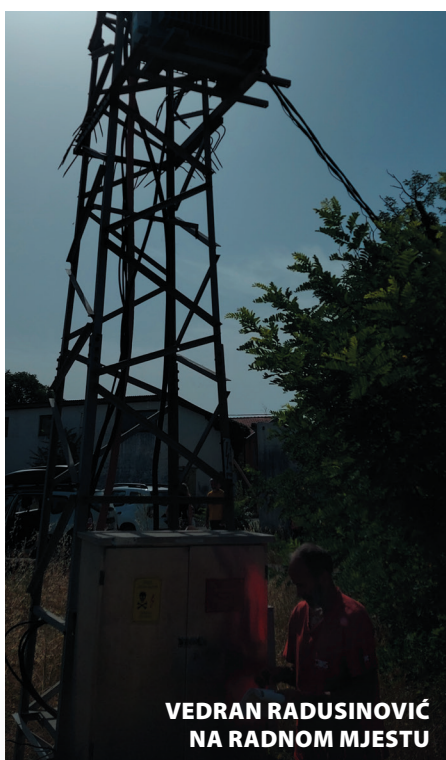
VEDRAN RADUSINOVIĆ NA RADNOM MJESTU

onlcamo tog vazdušnog voda u cilju lakše manipulacije i bržeg pronalaženja kvarova.