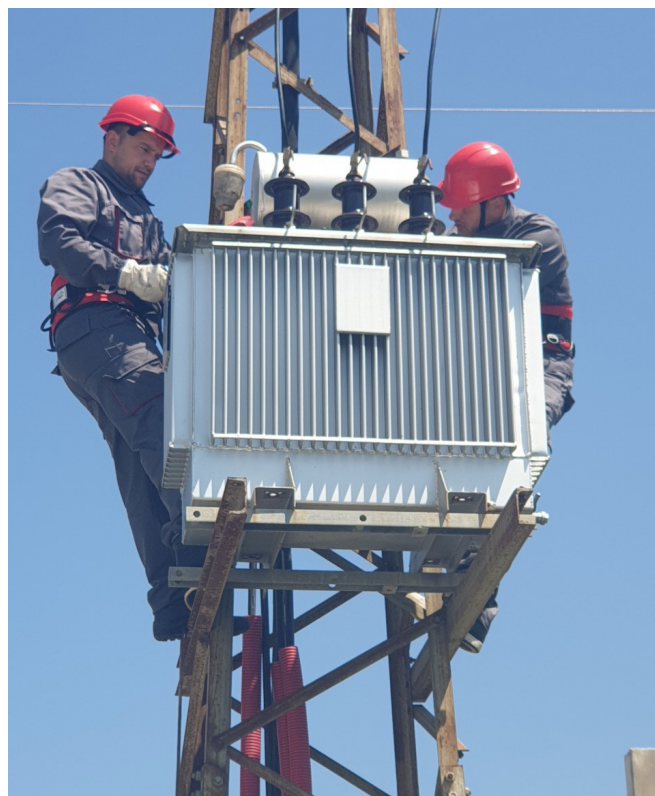
Revitalizacija DV "Šas"

Prema njegovim riječima, na NN mreži "Pistula 2" prema Nikezićima, gdje je ljeti dosta nizak napon,