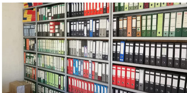
Centralna arhiva Regiona 6 u Mojkovcu

- Tako je omogućena bolja dostupnost dokumentacije za potrebe njenih korisnika, a pored navedenog formirana je i Centralna arhiva za Region 6 u Mojkovcu. Sve to urađeno je u saradnji sa Sektorom za održavanje koji nam je ustupio fizičke radnike i izradio namjenske police. U